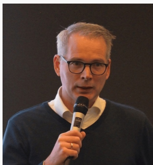
Van de voorzitter Kleine en grote radars

Afgelopen seizoen ging ik een weekendje op en neer naar Maria Alm. De staande reis had ik in mijn eerste vier jaar nog niet bezocht, dus daar moest verandering in komen. In dat weekend wisselt ook de eerste week volwassen zittend naar de tweede week.